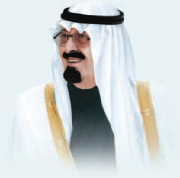
خادم الحرمين الشريفين الملك عبدالله بن عبدالعزيز آل سعود