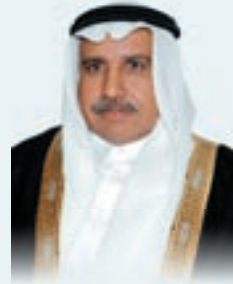
سعادة الدكتور خالد بن إبراهيم الجندان