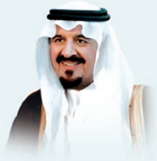
صاحب السمو الملكي الأمير سلطان بن عبدالعزيز آل سعود ولي العهد نائب رئيس مجلس الوزراء وزير الدفاع والطيران والمفتش العام