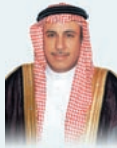
سعادة الدكتور خالد بن عبدالله السويلم