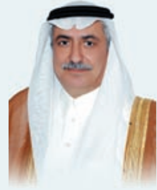
معالي الدكتور إبراهيم بن عبدالعزيز العساف وزير المالية - رئيس مجلس الإدارة