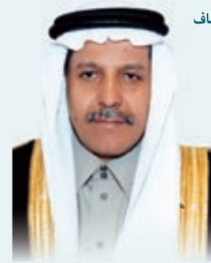
معالي المهندس يوسف بن إبراهيم البسام نائب الرئيس والعضو المنتدب